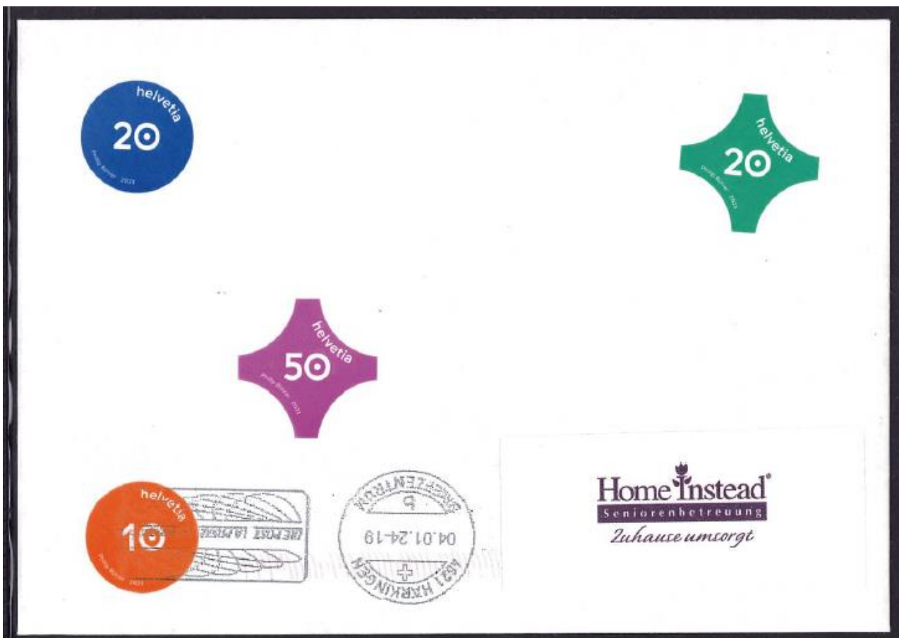
Schweiz 2023: Konfetti, mit diesem Brief war die Stempel-Maschine in Härkingen offensichtlich überfordert.