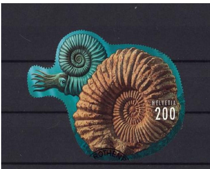
Schweiz 2015: Ammonit