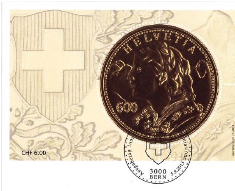
Schweiz 2013: «Goldvreneli» mit Goldglanz