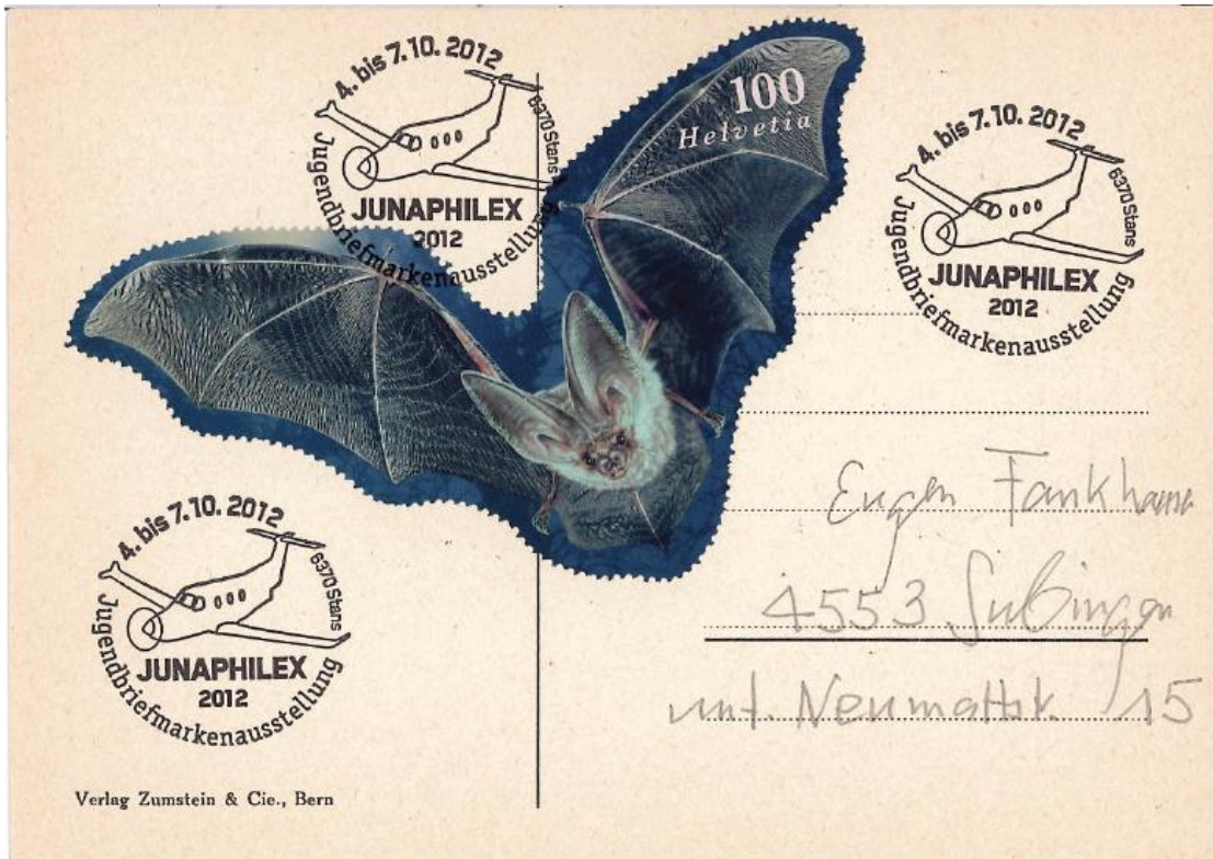
Schweiz 2012: Fledermaus aus Sonderblock «Braunes Langohr»

Tiere sind besonders beliebte Formengeber und werden mit einem Laser geschnitten.