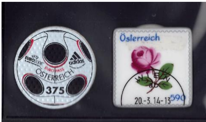
Österreich 2014: Es geht auch bescheidener ... Fussball-Briefmarke aus echtem Leder und Briefmarke aus Porzellan