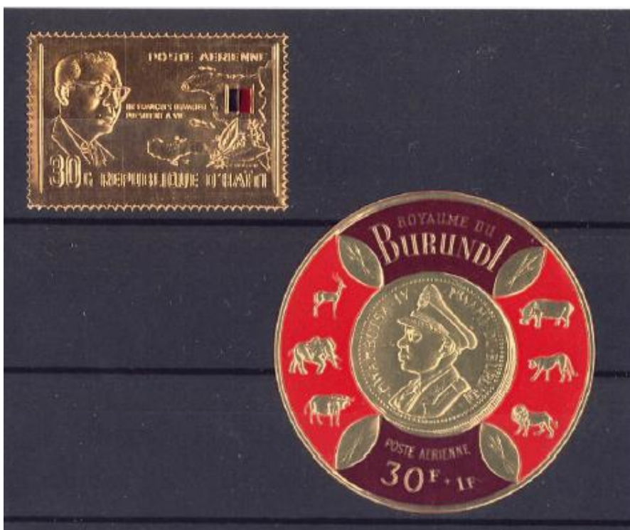
Auch andere Länder glänzten. 2 Briefmarken welche Metallanteile enthalten.