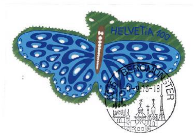
Schweiz 2016: Schmetterling