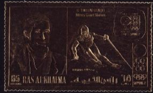
VAE 1972: Olympiade Sapporo