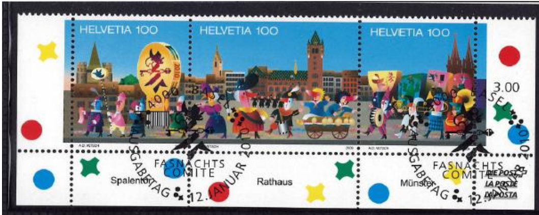
Schweiz 2010: 100 Jahre Basler Fasnacht