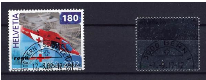
Mit Silberglanz. Schweiz 2002: 50 Jahre REGA Schweiz 2017: Brief vs. E-Mail